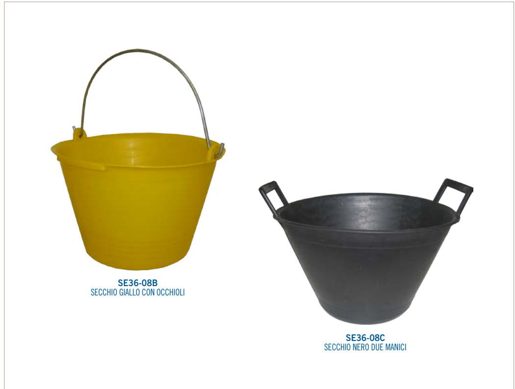
SE36-08B SECCHIO GIALLO CON OCCHIOLI