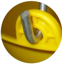
Dettaglio del secchio con occhio